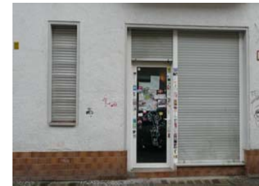
Mutmaßlicher Versammlungsort des Club für sich.

andere, viel weitergehende Fragen, z.B. wie verhalte ich mich auf der Arbeit und wie gehe ich mit meinen Kollegen um. Was tu ich hier überhaupt? Was mache ich eigentlich als Kommunistin auf der Arbeit, wenn