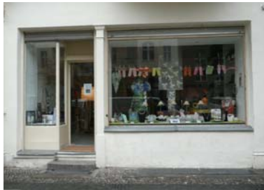
Gründungslokal des Clubs, heute modisches Handschuhgeschäft.

wiederholt von Umzügen unterbrochen und mal von mehr und mal von weniger Menschen besucht. Während der zwei Jahre seines Bestehens ist der Club sicherlich von mehr als 100 verschiedenen Personen aufgesucht worden, was trotz mancher beschaulicher Abende in bekannter Runde doch zeigt, dass es unter Kommunisten ein Bedürfnis nach einem regelmäßigen Anlaufpunkt gibt.